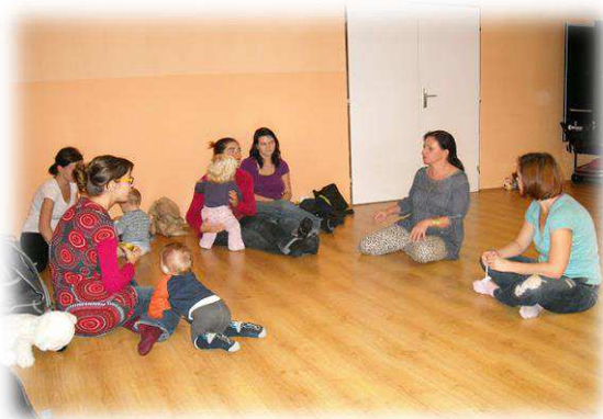
Školení maminek - dobrovolnic