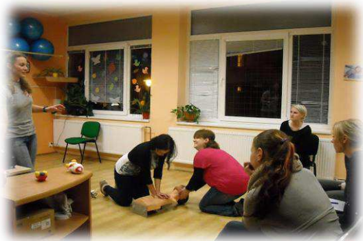
Kurz první pomoci

V rámci dalšího vzdělávání dobrovolníků pořádáme v DoRA Centru kromě pravidelných a povinných supervizí i mnoho workshopů, seminářů a kurzů. Pro velký zájem ze strany dobrovolníků kurzy nadále pokračují i v roce 2015.