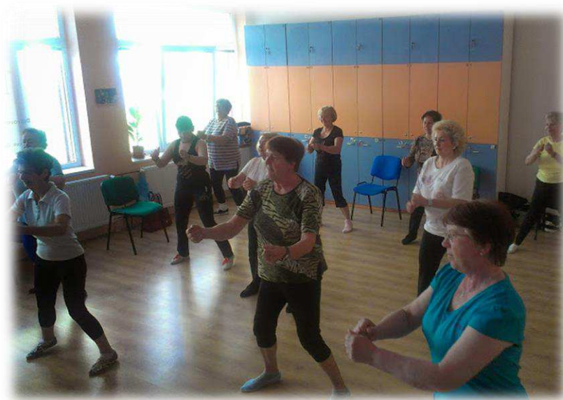
Pravidelné cvičení seniorek v DoRA Centru

Klub aktivních seniorů – jedná se o projekt pro seniory organizovaný formou pravidelných i jednorázových aktivit a workshopů. Cílem je oživení společenského života mladších i starších seniorů a zapojení do aktivního stárnutí v lokalitě Vinic. V DoRA Centru nabízíme seniorům mnoho aktivit a programů, do kterých se mohou zapojit (cvičení pro seniory, podzimní, zimní, jarní workshopy, kurzy německé konverzace či prosté posezení u kávy). Pravidelně dochází do DoRA Centra kolem 40 seniorů týdně.