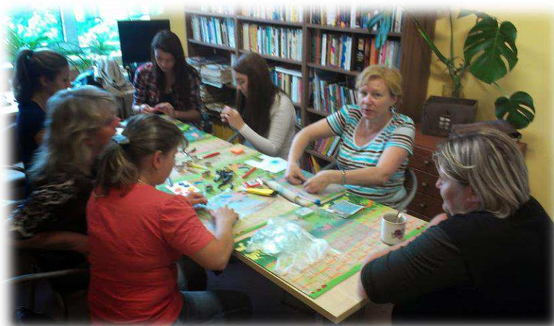
Kreativní tvoření maminek

Spolupráce s organizací David a Goliáš – nezisková organizace je sdružením rodičů a přátel handicapovaných dětí. Maminkám postižených dětí pravidelně poskytujeme zdarma naše prostory DoRA Centra pro společné setkávání, pro členky připravujeme pravidelné tematické workshopy.