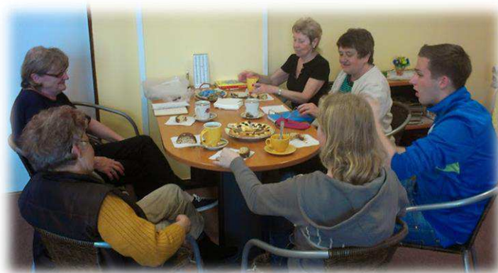
Kurzy německé konverzace v DoRA Centru

Spolupráce s Klubem dvojčat a vícerčat – organizace spojující rodiče dvojčat a vícerčat. Vzájemná spolupráce je založena na koordinaci dobrovolnických aktivit v prostorách DoRA Centra.