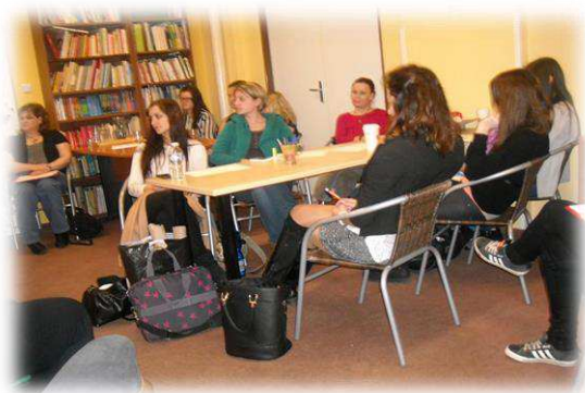
Kurz psychologie - Zvládání stresu a emocí