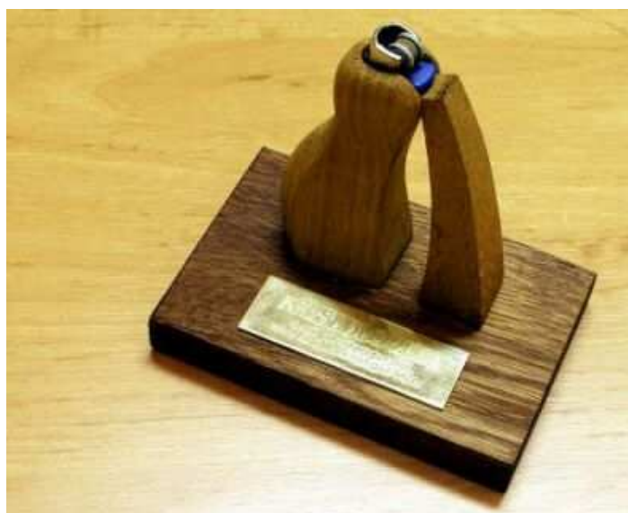
Křesadlo 2001 - 2002

Za rok 2002 to bylo celkem 31 křesadel, které kromě Prahy předávali naši partneři v šesti městech – Česká Lípa, České Budějovice, Pelhřimov, Olomouc, Ústí nad Labem a Zlín.