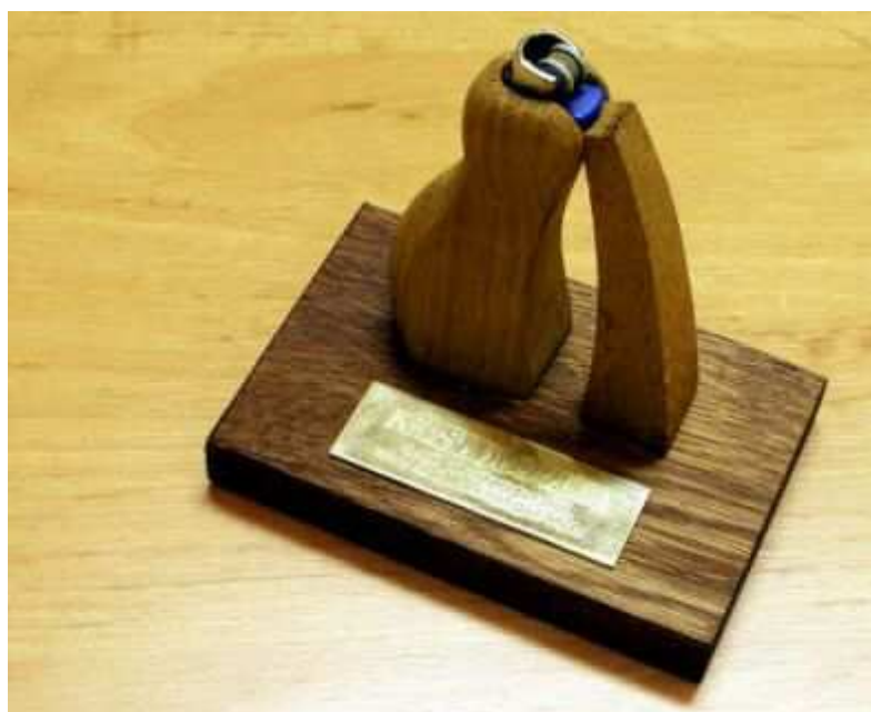
Křesadlo 2001 - 2002

Za rok 2002 to bylo celkem 31 křesadel, které kromě Prahy předávali naši partneři v šesti městech – Česká Lípa, České Budějovice, Pelhřimov, Olomouc, Ústí nad Labem a Zlín.